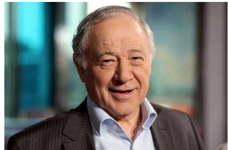
Eugène Saccomano, c'est celui que j'écoutais plus jeune à la radio.